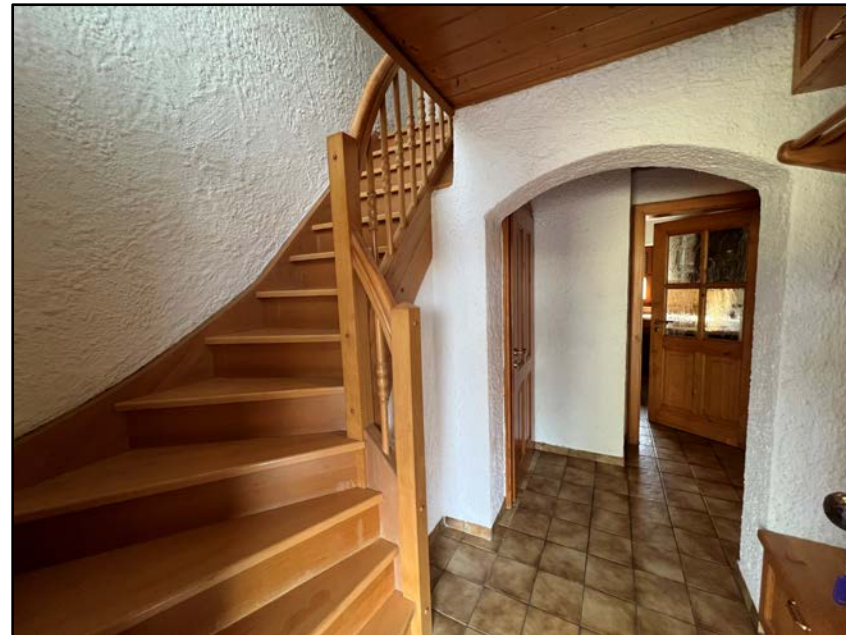
Flur Treppenhaus EG