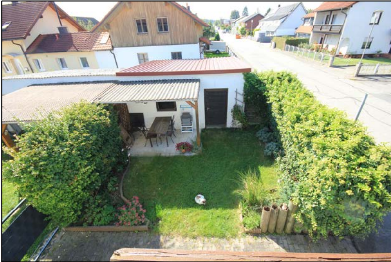
Blick vom Balkon